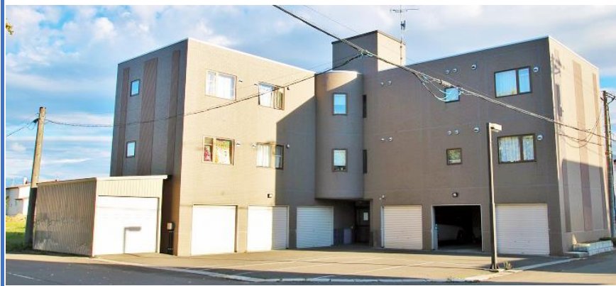
Century Heights 101