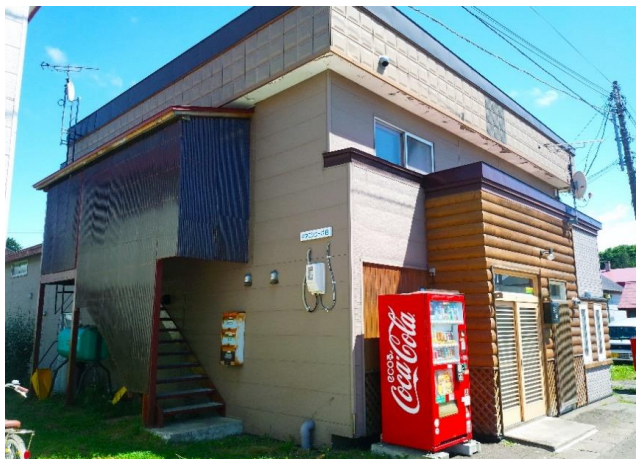
Kita Nishi Corp B201